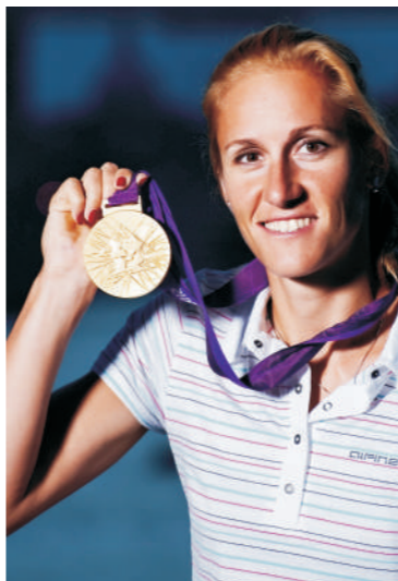
Miroslava Knapková, veslařská olympijská vítězka ve skifu Londýn 2012

Tělo vrcholového sportovce je extrémně namáháno, a aby dobře fungovalo, potřebuje být zdravé a plné sil. Proto hodně sportovců po sezóně jezdí do lázní zregenerovat, doléčit různé zranění, odpočinout si a načerpat novou energii. Je to důležité proto, aby tělo bylo zdravé a vydrželo podávat maximální výkony v dalším ročním tréninkovém cyklu. Priessnitzovy lázně mají tu výhodu, že si zde maximálně odpočinu, v rámci kvalitních procedur zregeneruji a navíc jsem maximálně hýčkána zaměstnanci, kteří se o mne starají.