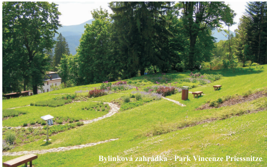
Bylinková zahrádka – Park Vincenze Priessnitze

kých protilátek. Zánět dýchacích cest je slabší, což se projevuje snížením dráždivosti průdušek. Úlevu pocítují i