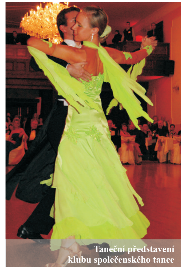
Taneční představení klubu společenského tance