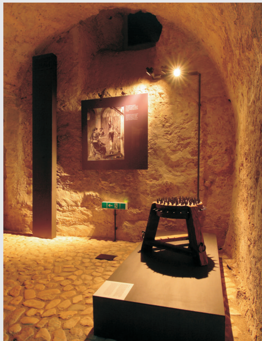
Vlastivědné muzeum Jesenicka, Stálá expozice čarodějnických procesů na Jeseníku v 17. století