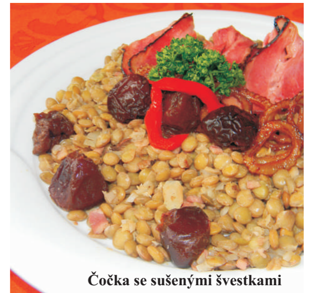
Čočka se sušenými švestkami