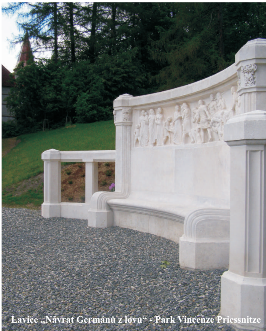
Lavice „Návrat Germánů z lovu“ - Park Vincenze Priessnitze