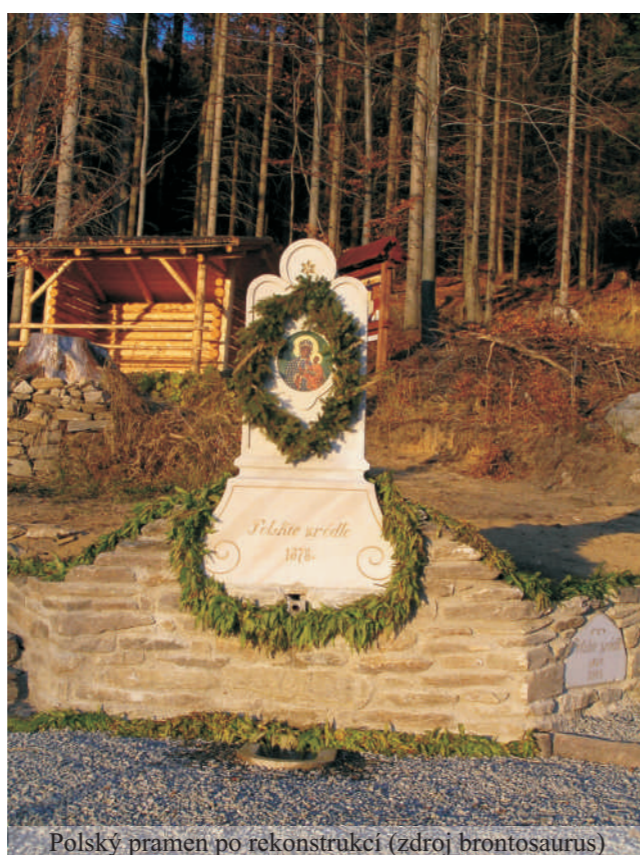
Polský pramen po rekonstrukci

Studniční vrch je na první pohled obyčejný kopec nad lázeňmi Jeseník, s převládající smrkovou monokulturou, kde ale každou chvíli narazíte na kamennou stavbičku s pramínkem vody. Přitom to není tak dávno, co se po