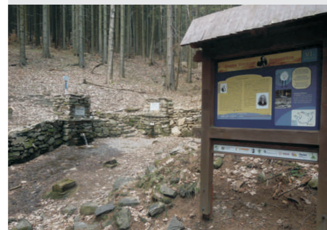
VI. zastavení Priessnitzovy stežky (zdroj brontosaurus)

Začíná u konečné autobusu v lázních, vede přes spodní část Balneoparku k Pražskému prameni a dále přes trojpramen Adéla-Flora-Adolf, pramen Anna, po Stezce Filozofů k Rumunskému prameni. Pokračuje přes Smrkový a Vilémův pramen k Jitřnímu prameni (kde začíná další „sesterská“ Stežka živé vody) a kolem Nadlerova kříže k Polskému prameni. Okruh má 6 kilometrů, je vyznačen „modrou kapkou“, končí na Jižním svahu nad lázněmi. U devíti pramenů najdete devět zastavení s texty o historii lázní od Tomáše Knoppa, na děti čeká Kapka Turistka a krátké básničky. Pro vycházku na stezku doporučujeme pevnou obuv a počítat s tím, že její projití vám zabere asi tři hodiny. Lze ji samozřejmě „proběhnout“ i rychleji, ale je to stezka Priessnitzova a ten vždy radil... nespěchat!