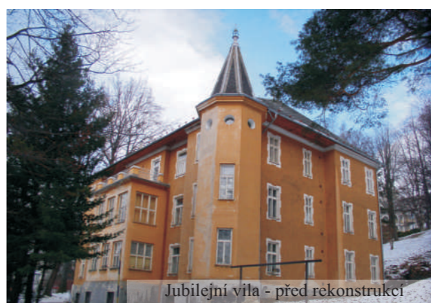
Jubilejní vila - před rekonstrukcí

upraveny pro klienty s tělesným postižením, což jistě přispěje ke zvýšení komfortu.