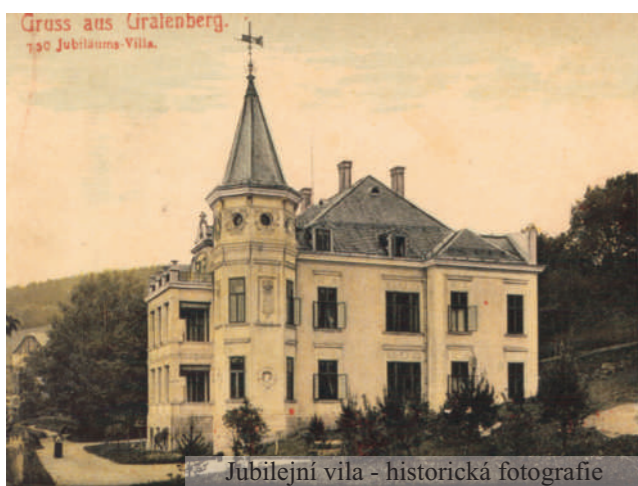
Jubilejní vila - historická fotografie

V minulém čísle Lázeňských pramenů jsme zařadili rubriku, ve které bychom vám rádi postupně představili naše lázeňské domy. Začali jsme naší vlajkovou lodí, sanatoriem Priessnitz, které je dominantou nejen lázeňského areálu. Jelikož se na stránkách tohoto májového vydání věnujeme našim nejmenším klientům, rozhodli jsme se vám tentokrát představit Jubilejní vilu. Tento lázeňský dům totiž v těchto dnech prochází společně s domem Mír finálními proměnami, které z kvalitní pobyt hostů v celém lázeňském areálu, především však rodičům s dětmi.