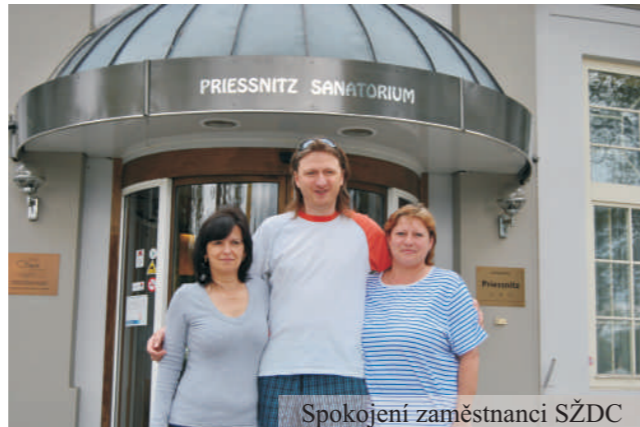
Spokojení zaměstnanci SZDC

Priessnitzovy léčebné lázně se pro rok 2013 staly exkluzivním dodavatelem kondičních pobytů jednoho z největších zaměstnavatelů v České republice.