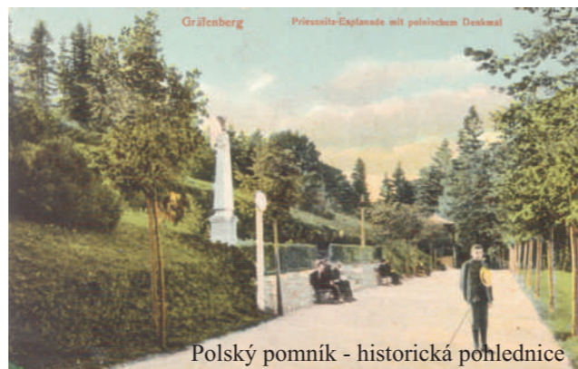
Polský pomník - historická pohlednice

Kolonáda v Priessnitzových léčebných lázních představuje nesporně z historického i současného pohledu výrazný fenomén jesenické krajiny. Tento fenomén je určen především využíváním přírodních sil ku prospěchu člověka. V tomto prostoru došlo bezesporu k využívání části jesenické krajiny nejenom pro účely