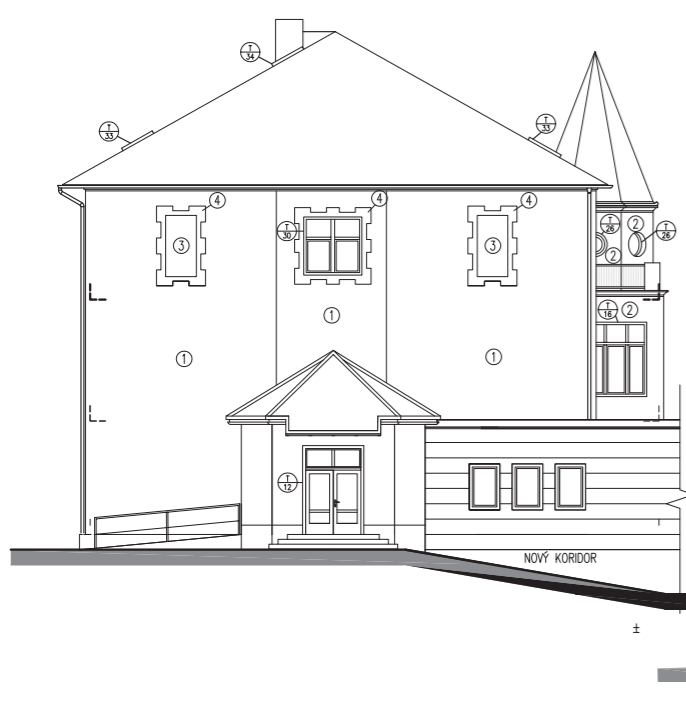
POHLED SEVEROZÁPADNÍ NOVÝ STAV M=1:100