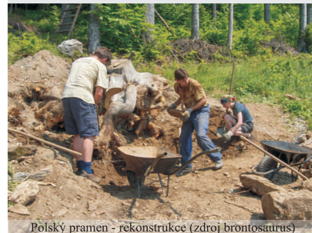
Polský pramen - rekonstrukce

Každou druhou středu si můžete přijít poslechnout povídání o obnově pramenů na Studničním vrchu s promítáním celé řady fotografií, které tento příběh dokumentují. Začátek vždy v 18 hodin, prezentuje Jiří Glabazňa.