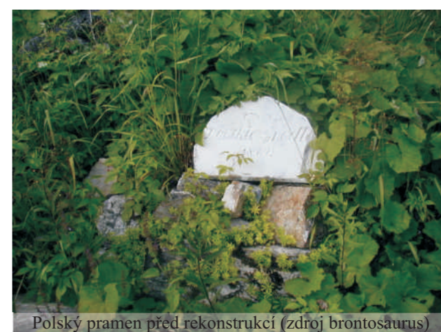
Polský pramen před rekonstrukcí

zadarmo, že za to dostávám něco, co nelze vyjádřit penězi, začínají trochu rozumět.“ Brontosauri akce jsou založeny na kombinaci dobrovolnické práce, zábavy a neformálního vzdělávání. Vznikají na nich party s přátelskými vazbami, které mají často vliv na celý další život mladých lidí. „I přes bohatý program byl zde na Studničním vrchu často největším zážitkem okamžik, kdy na konci tábora stáli účastníci před obnoveným pramenem se vzpomínkou na to, jak stejné místo vypadalo ještě před dvěma týdny. A s hřejivým